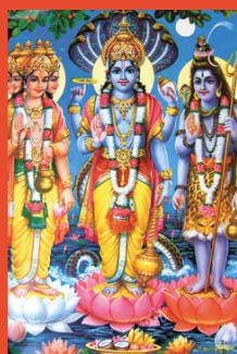
Brahma, Vishnu en Shiva

Je hebt vast wel eens een hindoeëgod gezien met meerdere armen of hoofden. Tegenwoordig kom je ze overal tegen: op T-shirts en tassen of als beeldje bij Xenos of Blokker. Sommige goden zijn makkelijk te herkennen aan hun kleur of aan hun apen- of olifantenkop. Maar ook de attributen en rijdieren kunnen je vertellen wie wie is. De lichaamshouding, handgebaren, kleding en sieraden van de goden hebben ook allerlei symbolische betekenissen.