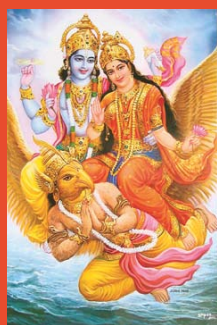
Vishnu en Lakshmi