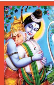
Rama en Hanuman