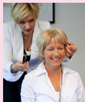
Een haarwerker geeft tips en adviezen over pruiken, sjals en mutsjes. Ook kan er gepast worden, wat vaak voor veel hilariteit zorgt.