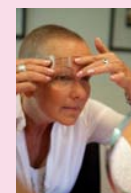
Je wenkbrauwen bepalen voor een groot deel je gezichtsuitdrukking. Met behulp van een sjabloon en waterproof poeder leer je om wenkbrauwen te tekenen.