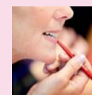
De speciaal getrainde vrijwilligers leren je bepaalde technieken aan, die je later ook thuis kunt toepassen.