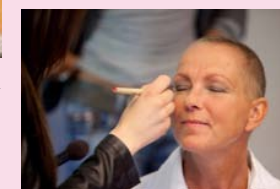
Schoonheidsspecialisten en visagisten laten zien hoe het aanzetten van de ogen je gezicht meer uitdrukking geeft.