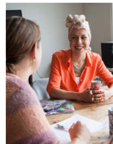
Ik wilde iets spectaculairs doen: desnoods zette ik een fruitmand op mijn hoofd!