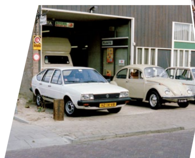
< De locatie waar het begon. De Jan Kriegenstraat in Woerden. Met maar 1 brug en weinig mogelijkheden om te groeien.